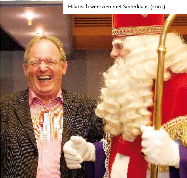
Hilarisch weerzien met Sinterklaas (2005)