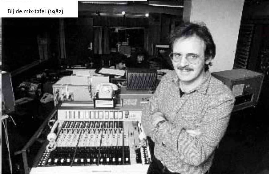
Bij de mix-tafel (1982)