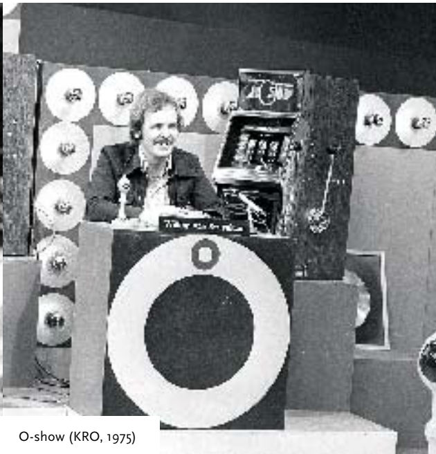
O-show (KRO, 1975)