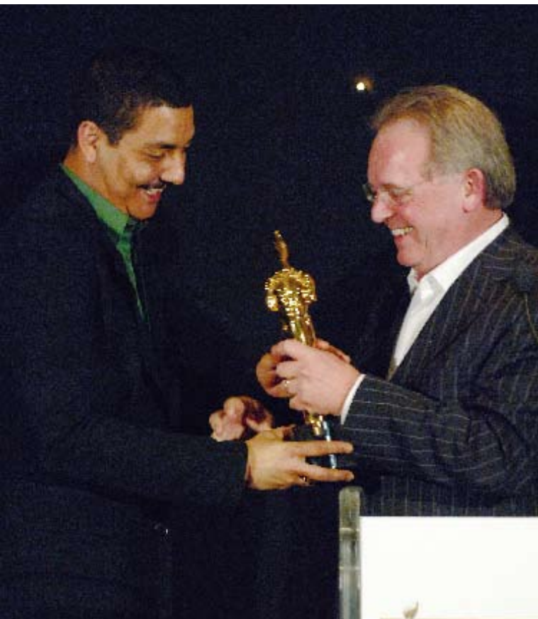
Overhandiging van een Gouden Beeld aan TV-persoonlijkheid Jörgen Raymann (2005)