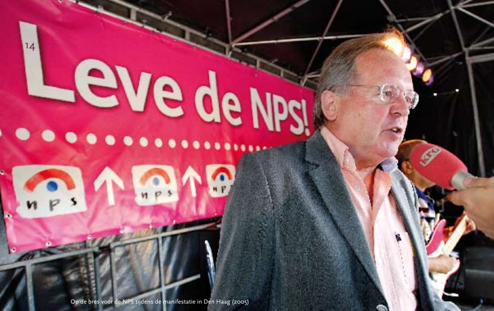
Op de bres voor de NPS tijdens de manifestatie in Den Haag (2005)

treedt hij in 1974 officieel in dienst van de VARA.